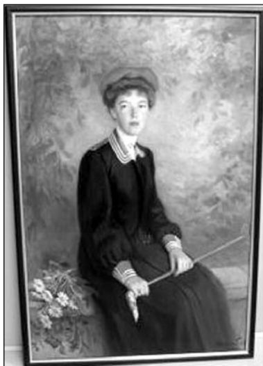
Выставка художественных работ Е.И.В. Великой Княгини Ольги Александровны — младшей дочери Им-